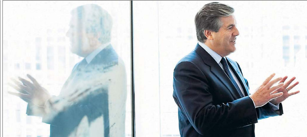
Josef Ackermann sieht sich als Krisenmanager. In den Augen vieler Bürger zeigt er aber zwei Gesichter.

Weitere Zerwürfnisse folgten. Erst nachdem Ende 2006 der zweite Prozess ohne eine Verurteilung beigelegt wurde, schien es, als könnten Deutschland und sein mächtigster Banker Frieden miteinander schließen. „Wir wollen Deutschland nicht verlassen“, sagte Ackermann im SZ-Interview. Dann kam die Finanzkrise und Ackermann fand aus der Figur des Buhmanns in eine neue Rolle. Er erklärte den Deutschen bei Maybritt Illner die Bankenwelt, zeigte sich mal reuig, mal als zupackender Krisenmanager und vor allem verkaufte er sich und seine Bank als Fels in der Brandung. Sein Ansehen in der Politik stieg und auch bei Tatort-Fans und Bild-Zeitungslesern lösten