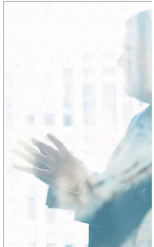
Josef Ackermann sieht sich als Krisenmanager.

Weitere Zerwürfnisse folgten. Erst nachdem Ende 2006 der zweite Prozess ohne eine Verurteilung beigelegt wurde, schien es, als könnten Deutschland und sein mächtigster Banker Frieden mit ein-